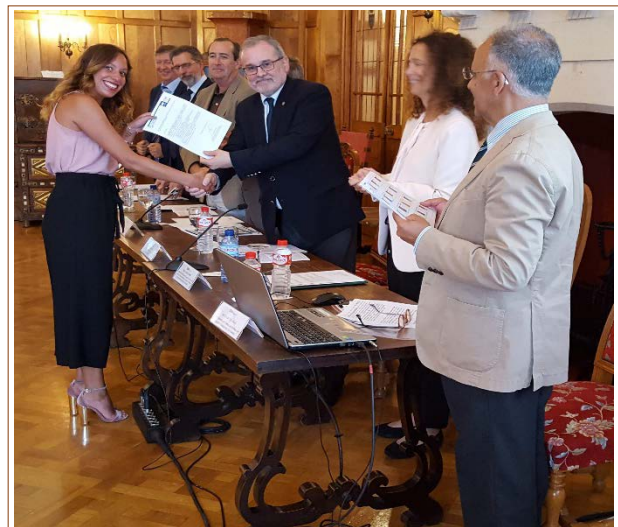
Imagen 5 Alumna durante la entrega de Certificados

De éstos, a lo largo de los 12 cursos desarrollados (2006-18), un total de 168 Arquitectos e Ingenieros , procedentes de Iberoamérica , lo han elegido para su formación de postgrado (Fig. 6). Hasta la fecha los países de procedencia de los matriculados, además de España, son los siguientes: Angola, Argentina, Bolivia, Brasil, Chile, Colombia, Costa Rica, Cuba, Ecuador, El Salvador, Guatemala, Honduras, Italia, México, Panamá, Paraguay, Perú, República Dominicana, Uruguay y Venezuela .